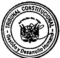
..... AUGUSTO FERRERO COSTA PRESIDENTE TRIBUNAL CONSTITUCIONAL