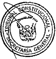
LUZ IMELDA PACHECO ZERGA Presidenta (e) del Tribunal Constitucional