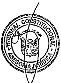
LUZ IMELDA PACHECO ZERGA Presidenta (e) del Tribunal Constitucional