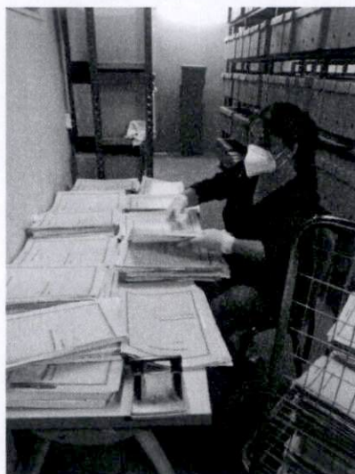
Personal de archivo central en labores